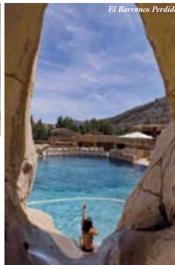
El Barranco Perdido

En los yacimientos , podrás comprobar el verdadero tamaño de los diferentes dinosaurios que habitaban en La Rioja. También podrás meter tus manos en las enormes huellas de estos animales, seguir sus rastros, o aprenderlo todo sobre ellos en el centro de interpretación .