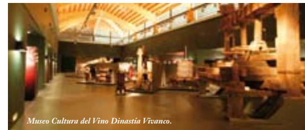
Museo Cultura del Vino Dinastía Vivanco.

Los más peques disfrutarán aprendiendo cómo se hace el vino de Rioja, pisando uvas para hacer mosto o corriendo entre los viñedos. Los abuelos riojanos llevan cientos de años enseñando a sus nietos cómo se cultiva la vid y cómo se hace el vino.