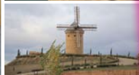
Molino de Ocón.