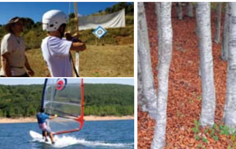
En La Rioja te esperan todo tipo de diversiones y deportes en la naturaleza. ¡Ven y disfrútalos!