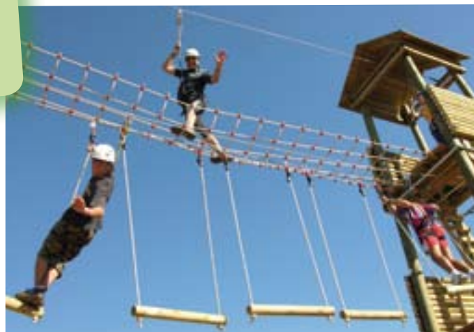
Parque de aventura "Sierra de Cameros" en Lumbreras.