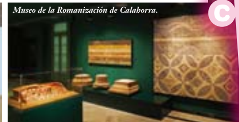
Museo de la Romanización de Calahorra.