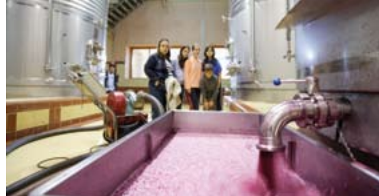
En las bodegas puedes aprender el proceso del vino ¡en directo!

D Para saber más, visita... • El Barranco Perdido • Centro Paleontológico de La Rioja (Igea) • Yacimientos de icnitas (huellas de dinosaurio) + info en... www.lariojaturismo.com/dinosaurios