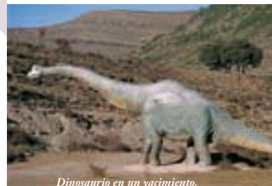
Dinosaurio en un yacimiento.

Hace miles de años, La Rioja era una zona pantanosa llena de dinosaurios. Hoy puedes ver sus huellas en la zona de sierra de La Rioja Baja. En Enciso , Igea y otros pueblos cercanos, se pueden conocer muchas cosas de estos grandes animales que fascinan a grandes y pequeños.