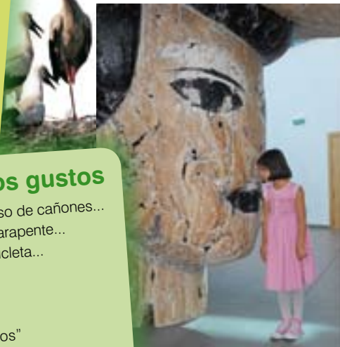
Museo Wurth. Agoncillo.

+ info en... www.lariojatourismo.com/La_Rioja_con_ninos