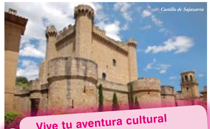
Castillo de Sajazarra